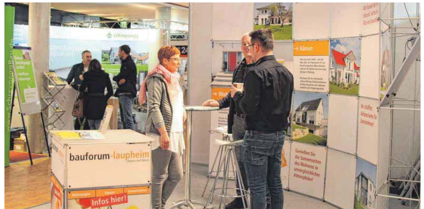
Zu vielfältigen Themen können sich die Besucher wieder auf der „Laupheimer Immotionale“ informieren.