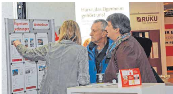
Messebesucher informieren sich über das Angebot.