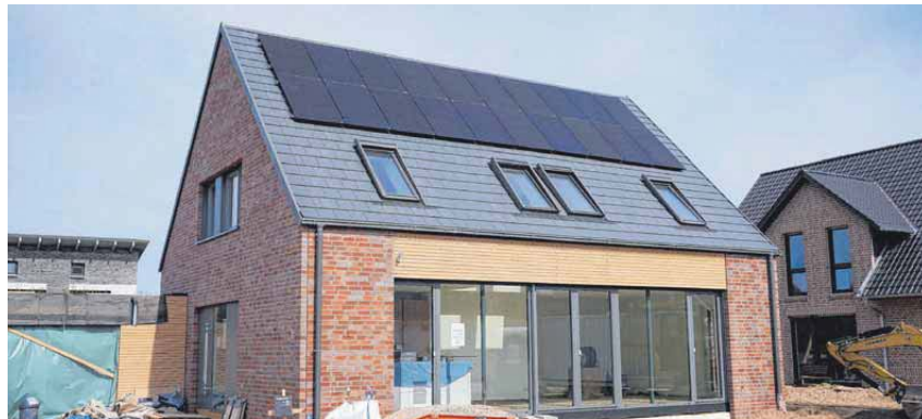
Gefragt wie nie zuvor: Viele Eigenheimbesitzer möchten ihr Dach mit Solarmodulen ausstatten.