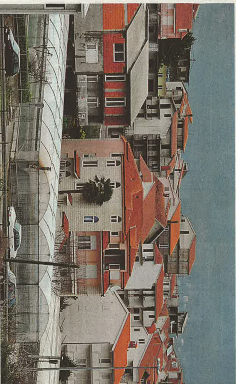
Bespravno sagradene kuće na splitskoj Siroubiji koje se pokušavaju legalizirati

Iako su agencije za nekretnine i grunтовrničari i dalje zbunjener ne znaju kako tumačiti izmjene i dopune Zakona o prostornom uređenju i Zakona o postupanju s nezakonito izgrađenim zgradama, u Ministarstvu zaštite okoliša, prostornog uređenja i gradnje su optimistični i smiruju građane